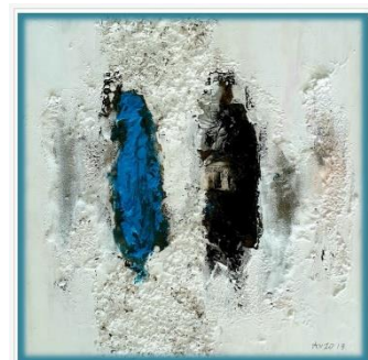
schilderij Mosab Anzo, zie blz. 2