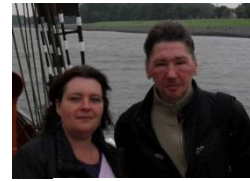
K. met partner